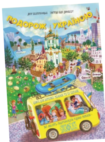
Ноа Кременчуцька “Подорож Україною” Іл.: Надія Дойчева-Бут. — Київ, 2015. — 10 с.

Робота з дітьми старшої групи за віммельбухом Н. Кременчуцької “Подорож Україною”